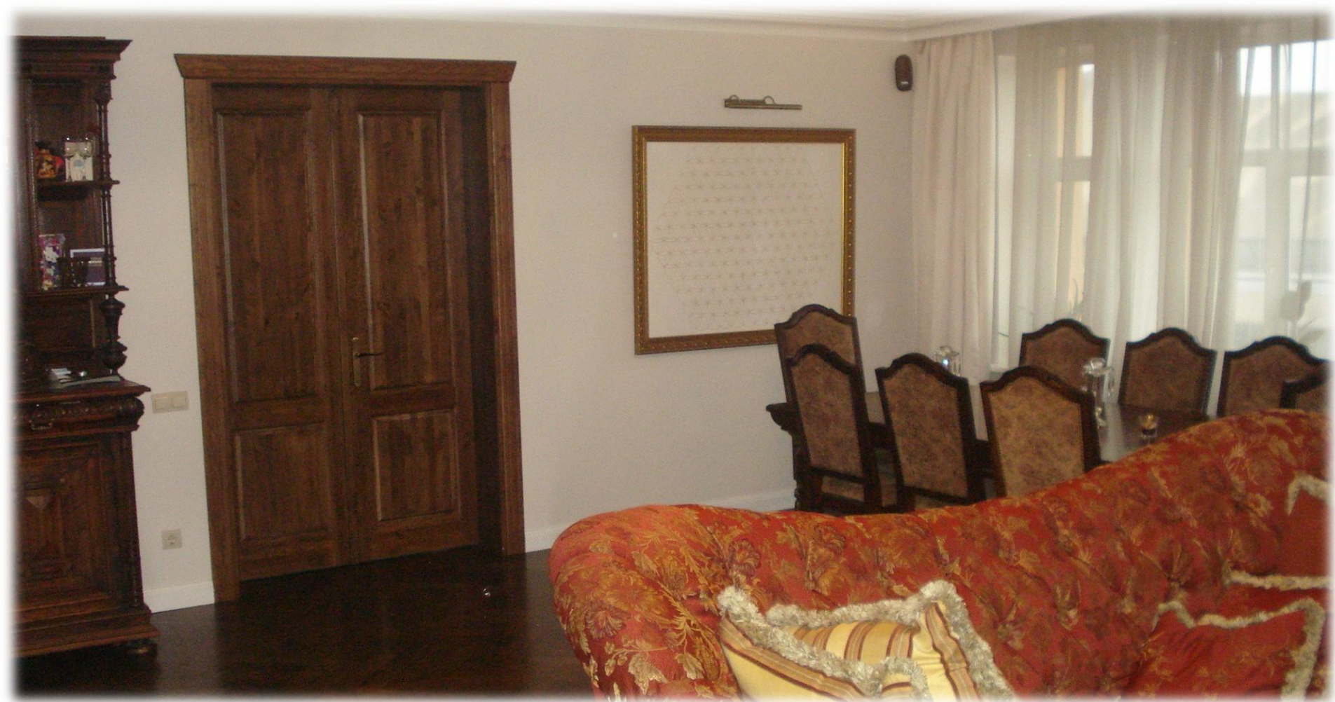
Деревянный обеденный стол Буфет 19 века