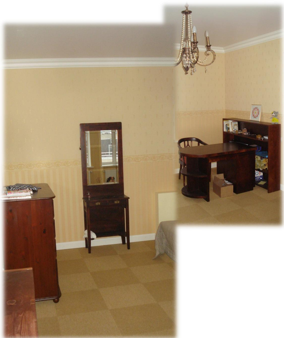
Спальня для гостей